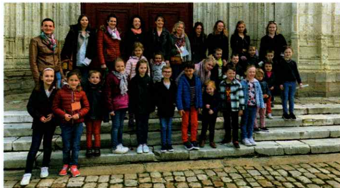
Groupe d'éveil à la foi Saint-Riquier 2022-2023

En attendant, venez rencontrer l'équipe de caté lors de la réunion de présentation qui aura lieu à l'abbatiale de Saint-Riquier le samedi 2 septembre à 10h30.