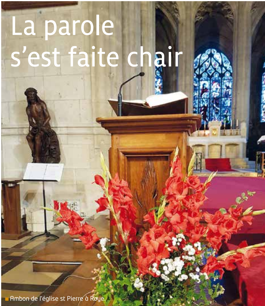
■ Ambon de l'église st Pierre à Roye.

D ans nos églises deux «tables» composent le mobilier du chœur: la Table de la Parole ou ambon d'où est proclamée la Parole de Dieu et la Table de l'eucharistie où sont consacrés le pain et le vin qui deviendront corps et sang du Christ. En effet, comme l'affirme saint Jérôme, l'Écriture est «une vraie nourriture et une vraie boisson» pour nos âmes. Le pape Benoît XVI confirme : «Dans la rencontre avec Jésus, nous nous nourrissons pour ainsi dire du Dieu vivant lui-même.» Et il précise : «La parole de Dieu est la personne de Jésus-Christ, le Fils du Père, fait homme...» Donc le christianisme n'est pas une religion du Livre mais du Christ vivant. Quand l'évangile selon saint Jean (1,14) proclame que «le Verbe s'est fait chair» , il évoque l'incarnation du Fils de Dieu en notre humanité; et aussi celle de la parole de Dieu dans les mots, les langues, les livres (Bible, lectionnaire). Ainsi la Parole nous visite si nous l'accueillons pour ce qu'elle est vraiment et elle nous rejoint dans les étapes de notre vie, éclairant