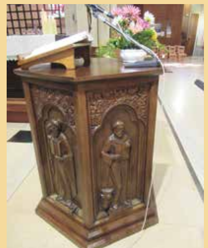
■ Ambon de l'église st Omer à Rosières.