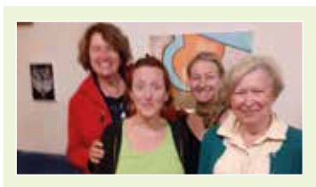
PAROISSE SAINT-SIMON DU MOLLÉNOIS