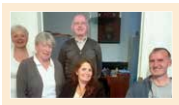
PAROISSE SAINT-ANTOINE DES MONTS ET VALLÉES