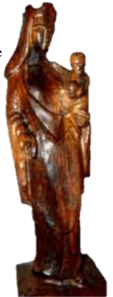
Notre-Dame de Foy - Canchy

3. Écoute la voix du Seigneur, prête l'oreille de ton cœur Tu entendas grandir l'Église, tu entendas sa paix promise Toi qui aimes la vie, ô toi qui veux le bonheur Réponds en fidèle ouvrier de sa très douce volonté Réponds en fidèle ouvrier de l'évangile et de sa paix.