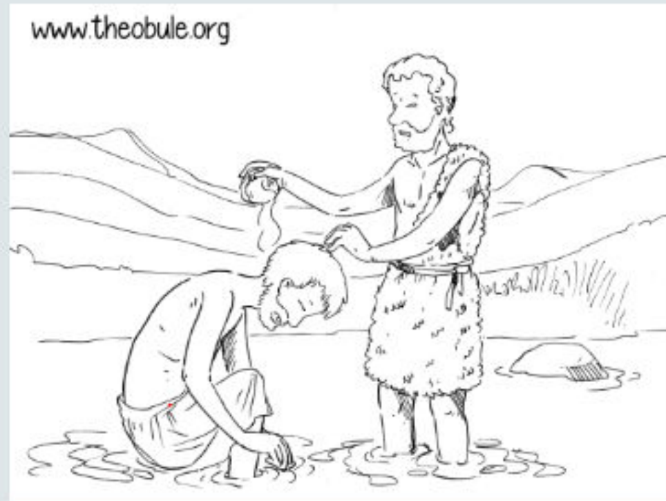
Coloriage Au bord du fleuve, Le baptême de Jésus

https://www.theobule.org/var/fichiers/image-jeu/jeu-a2s3s5-coloriage-au-bord-du-fleuve.jpg