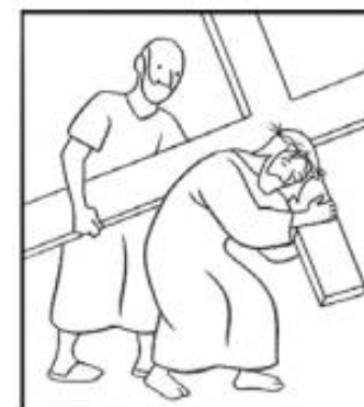
Simon de Cyrène aide Jésus à porter sa croix