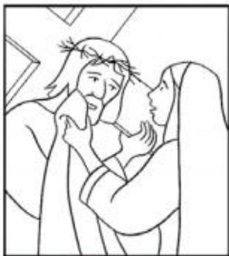
Véronique essuie le visage de Jésus