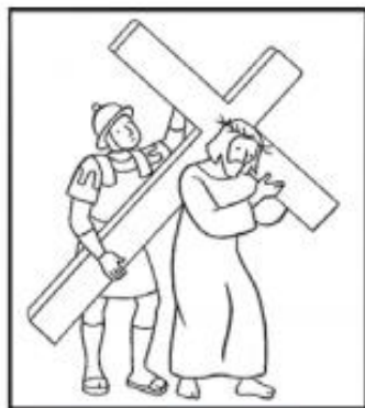
Jésus est chargé de sa croix