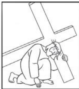
Jésus tombe pour la première fois