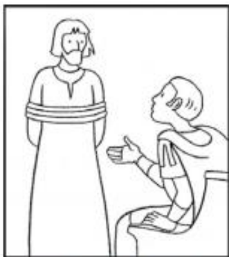
Jésus est condamné à mort