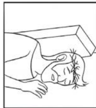
Jésus tombe pour la troisième fois