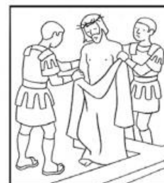
Jésus est dépouillé de ses vêtements