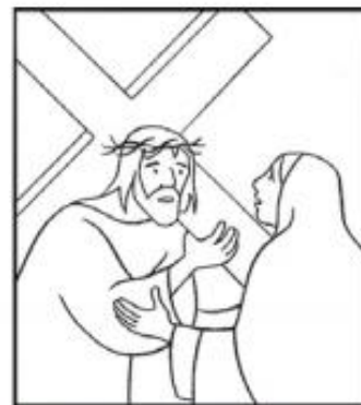
Jésus rencontre sa mère