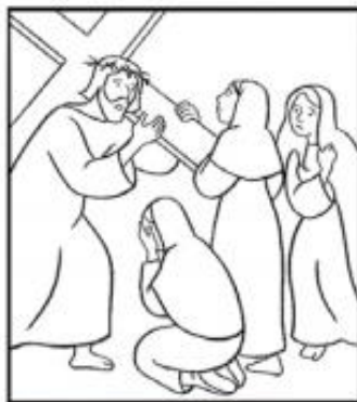
Jésus console les filles de Jérusalem