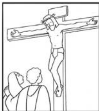
Jésus meurt sur la croix