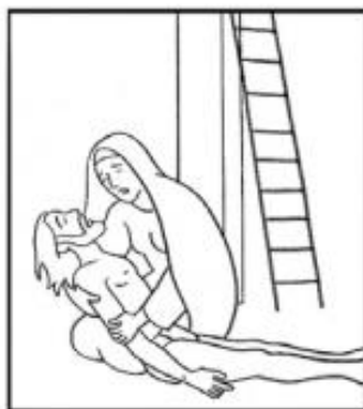
Jésus est descendu de la croix et remis à sa mère