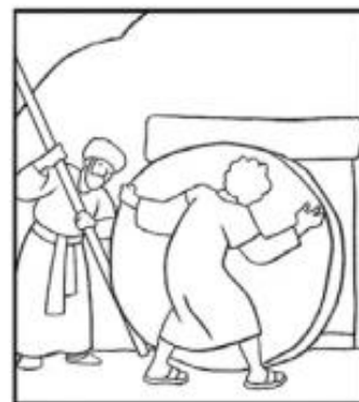
Jésus est mis dans le tombeau