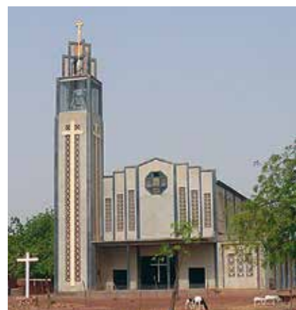
La cathédrale de Nouna au Burkina Faso.

Il m'a nommé curé de la paroisse cathédrale de Nouna et membre du conseil