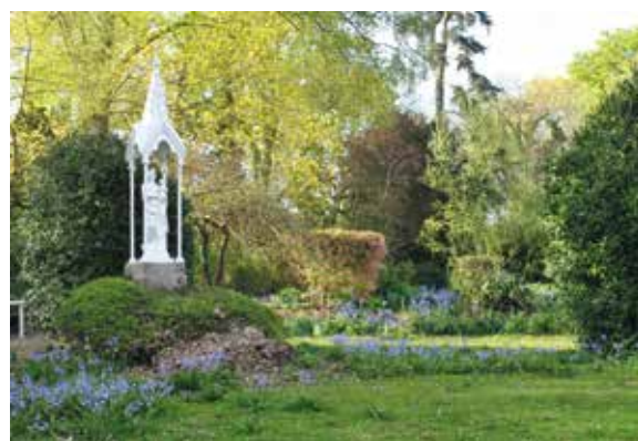
Jardin de la maison diocésaine à Amiens.

Merci aux « Fléristes sentinelles de l'Espérance » promotion 2015-2017.