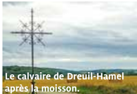
Le calvaire de Dreuil-Hamel après la moisson.