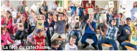
La fête du catéchisme.