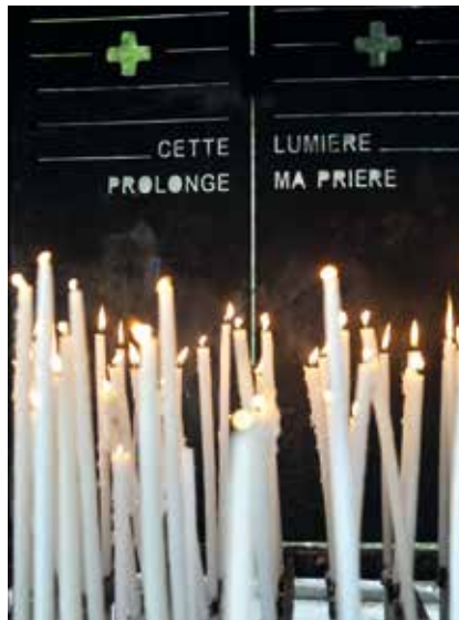
De nombreuses intentions de prières à Marie avaient été confiées aux pèlerins.

FRANÇOISE HOUBART, POUR LES PÈLERINS DE OISEMONT