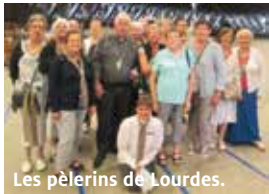
Les pèlerins de Lourdes.