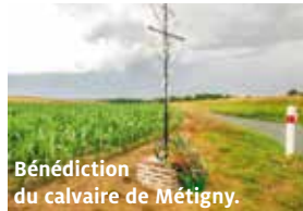
Bénédiction du calvaire de Métigny.