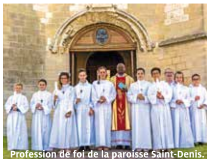
Profession de foi de la paroisse Saint-Denis.