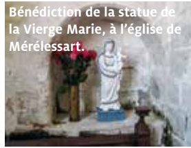
Bénédiction de la statue de la Vierge Marie, à l'église de Mérélessart.