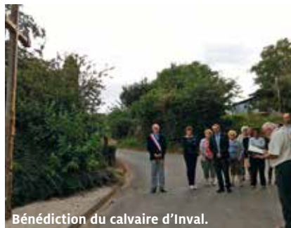
Bénédition du calvaire d'Inval.

comme le signe de la foi. Accorde-nous de rester unis ici-bas au mystère de la Passion du Christ et d'avoir ainsi la joie de participer pour toujours à sa résurrection.