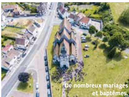
De nombreux mariages et baptêmes.