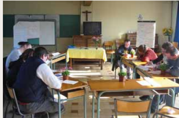
Une rencontre de préparation au mariage

Service diocésain de la formation permanente