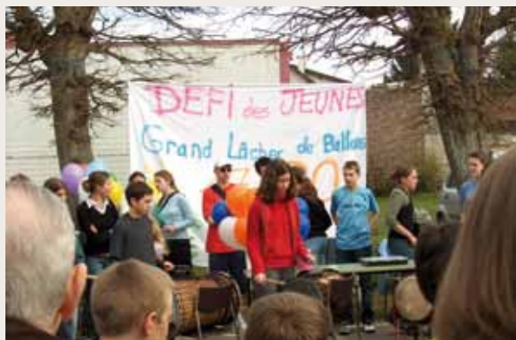
Opération « Bouge ta planète » du CCFD

- Jésus Christ est le vrai berger. Lui, le maître, est venu non pour être servi mais pour servir en donnant sa vie. Il va à la recherche