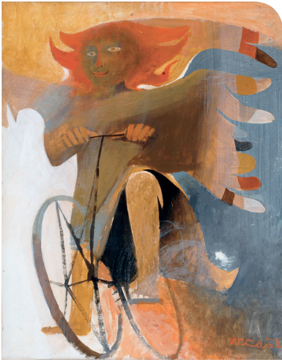
Ange espiègle, Arcabas